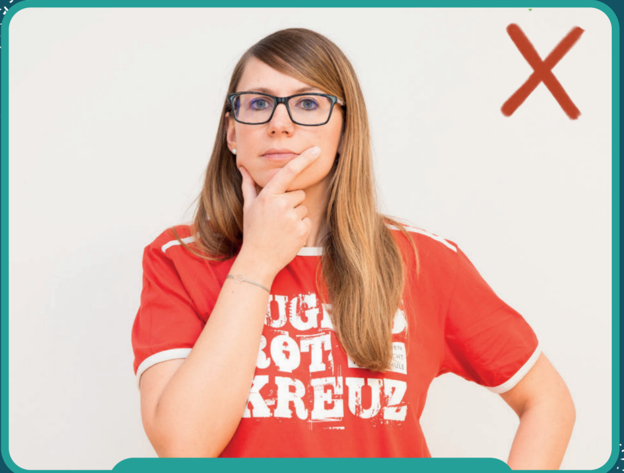
nicht ins Gesicht greifen