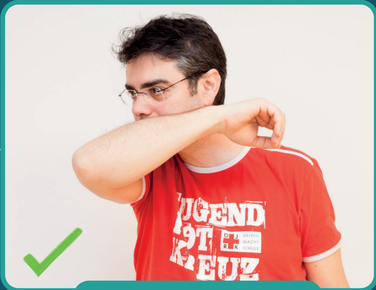
in die Armbeuge husten/niesen