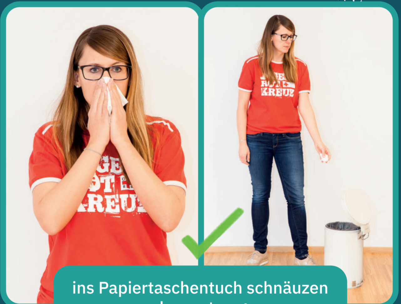
ins Papiertaschentuch schnäuzen und es entsorgen